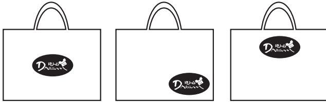
①中心 ②右下 or 左下 ③上 or 下

※園章・ロゴマークをデザインに入れる場合は、鮮明な印刷物（別紙可）またはデータにて園章をご提出ください。